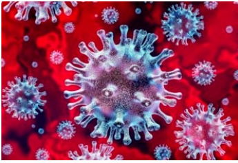
Afbeelding Corona virus